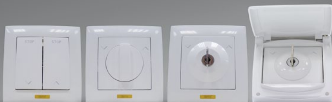
Inversor IDM Serie 90 Blanco

Ofrecemos una variada colección de pulsadores e inversores para todas las necesidades estéticas y de seguridad.