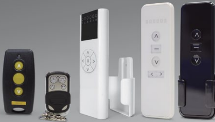
Minus (1 canal)

Emisores Nuestra gama de emisores cubre todos los aspectos necesarios para el funcionamiento de uno o varios motores de una vivienda.