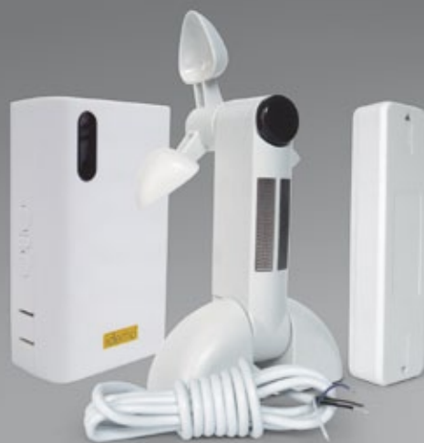
Viento-Sol-Lluvia + Receptor WLR-M