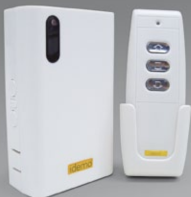
Kit Idemo® M.B.L.B.PL. (Emisor 1 canal + Receptor IDR)

Sensores Automatice su motor con cualquier sensor de nuestra gama.