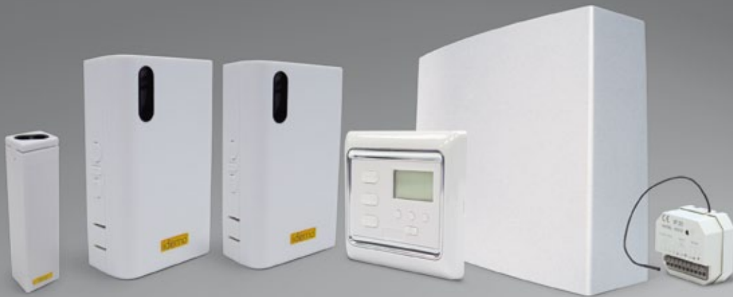
MINI IDRМ (Radio)

Receptores La selección de receptores que ofrecemos consigue la mejor comunicación con nuestros emisores y ofrece soluciones variadas.